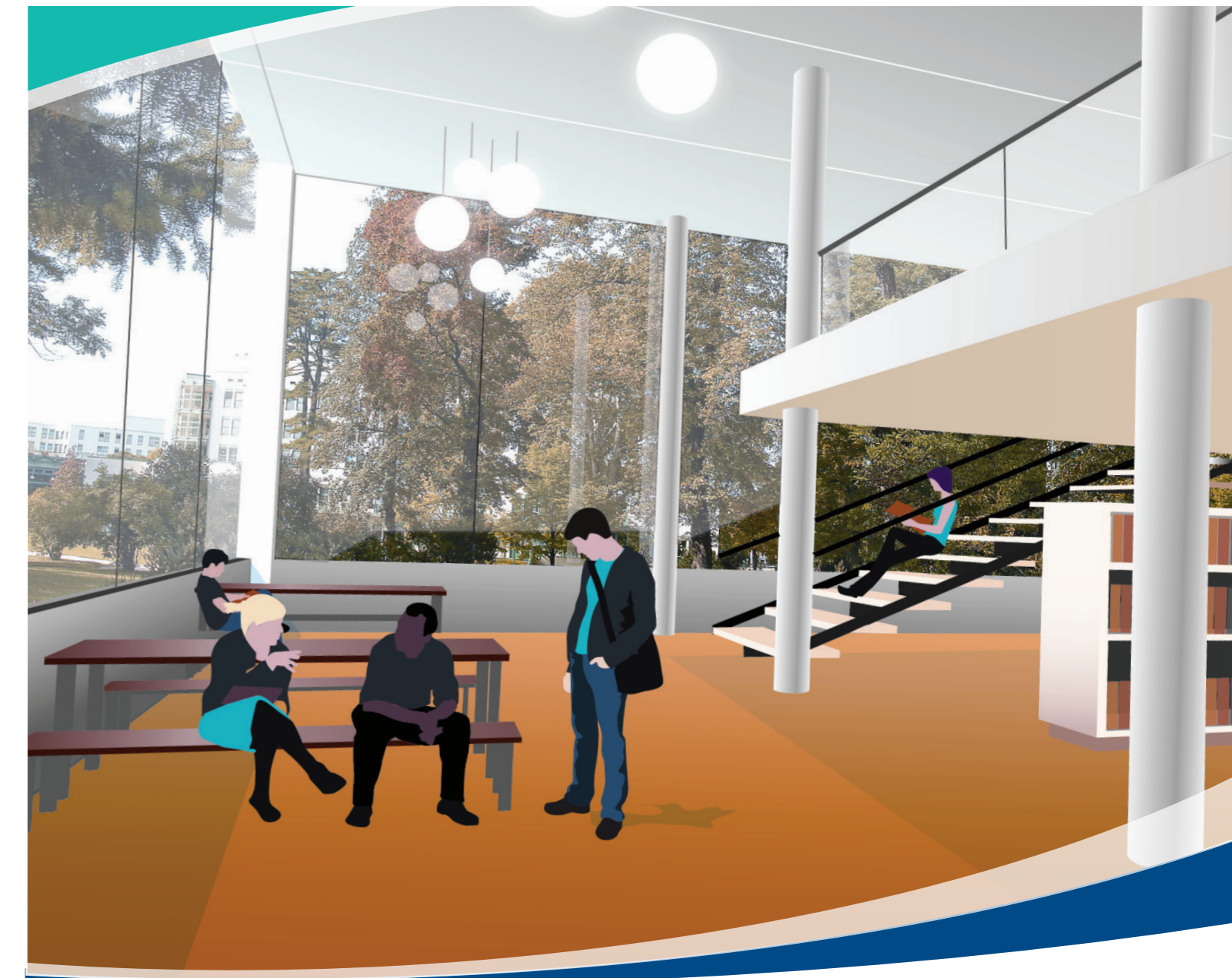
Systemair • Inhouse studio • 2011

Systemair производит энергоэффективную продукцию, которая создает благоприятный микроклимат в помещении. Наша продукция не загрязняет воздух и воду. Принятие мер по защите окружающей среды является одним из главных направлений нашей деятельности, мы постоянно улучшаем нашу продукцию и процесс производства для того, чтобы максимально сократить влияние на окружающую среду. Все детали и компоненты нашей продукции подлежат вторичной переработке и являются экологически чистыми.