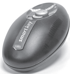
Dimensioni (mm) / Dimensions (mm)

→ LEGGI E CONSERVA QUESTE ISTRUZIONI ← READ AND SAVE THESE INSTRUCTIONS